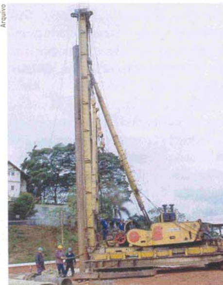
Estacas pré-fabricadas prevalecem hoje nas fundações

Não tenho dúvidas. Temos vários Leonardos da Vinci que usam receiti-